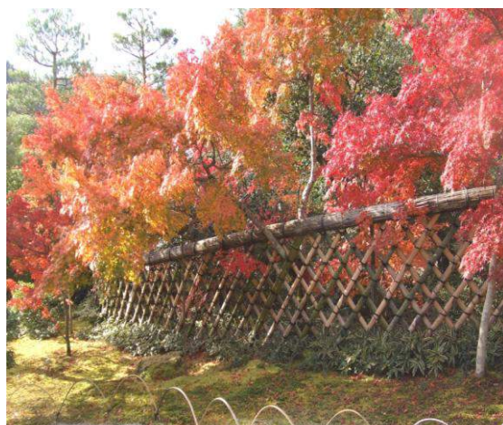
光悦がデザインした光悦寺の光悦垣

本法寺の方は、大徳寺と御所を直線で結ぶとちょうど真ん中くらいにあります。本阿弥家の菩提寺であり、光悦作とされる枯山水庭園「三つ巴の庭」が有名です。