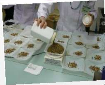
処方箋に基づく漢方調剤薬局