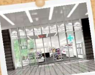
JRゲートタワー15階にある門前薬局