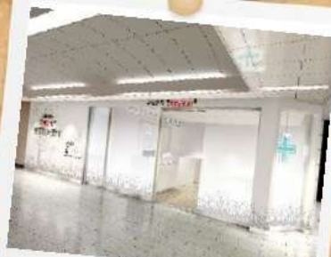
名古屋医療センターの門前薬局