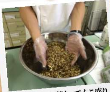
きざみの生薬も てんこ盛り