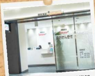
栄クリスタル広場前の面薬局