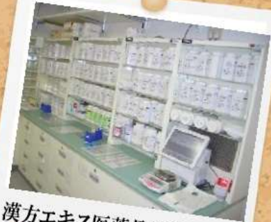
漢方エキス医薬品使用量No.1