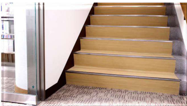
▲館内階段（1階より） 上は2階研究用閲覧室です。