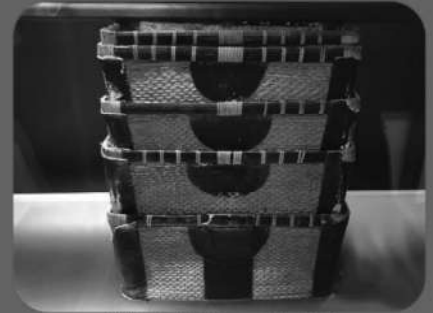
創業当時使われた柳行李